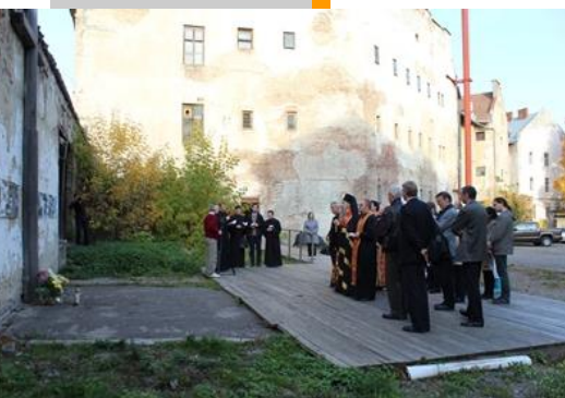
Gemeinsames Gebet an der Erschießungswand des ehemaligen NKWD/Gestapo/KGB- Gefängnisses im Lemberg

Im Zusammenhang mit der jährlichen Stiftungsratssitzung fand am 11. Oktober 2013 in Lemberg ein Studententag zum Umgang mit dem totalitären Erbe in der Ukraine statt. In den Räumen des ehemaligen NKWD/Gestapo/KGB – Gefängnisses in der Lonski-Strasse setzten sich die Teilnehmenden mit der gegenwärtigen Bedeutung der Erinnerung an das totalitäre Erbe in der Ukraine auseinander. Es wurde deutlich, welche politische Sprengkraft nach wie vor in diesen Erinnerungen liegt. Für die demokratische Entwicklung der Ukraine und die Entwicklung einer am Gemeinwohl interessierten politischen Kultur kommt der Wiederherstellung tragfähiger gesellschaftlicher Beziehungen eine zentrale Rolle zu.