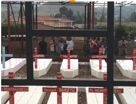
Besuch in Buta, Ort eines Massakers an den Schülern eines kleinen Seminars

Vom 11. – 16. November 2013 führte die Deutsche Kommission Justitia et Pax gemeinsam mit der AGEH und der Burundischen Kommission Justitia et Pax einen internationalen Workshop zum Umgang mit gewaltbelasteter Vergangenheit durch. Am Beispiel der Erfahrungen mit dem blutigen Konflikt in Burundi und seinen Folgen sind die 40 Teilnehmenden aus verschiedenen Ländern, Afrikas, Lateinamerikas und Europas in den Austausch darüber getreten, welche Möglichkeiten es gibt, zu Versöhnungsprozessen beizutragen. Im Laufe der Tage trafen die Teilnehmenden sowohl Opfer, ehemalige Kombattanten, zivilgesellschaftliche Akteure als auch Vertreter der Regierung und der Opposition.