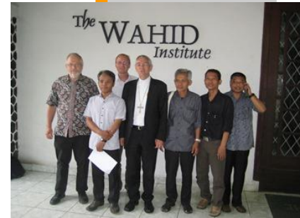
Die Teilnehmer der deutschen Delegation mit den Mitarbeitern des Wahid-Instituts eines islamischen Gesellschaftsinstituts in Jakarta